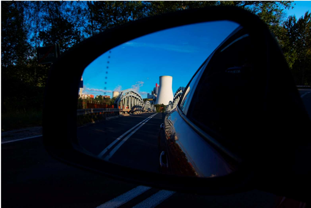
W kategorii "Zdjęcie zdaniem turysty obrazujące turystykę motorową"