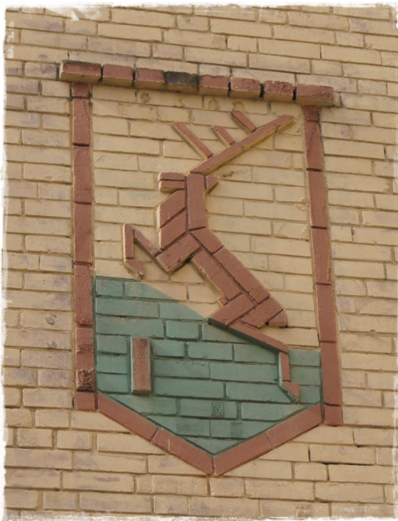
Herb Piły na elewacji jednej z wież budynku Szkoły Policji w Pile