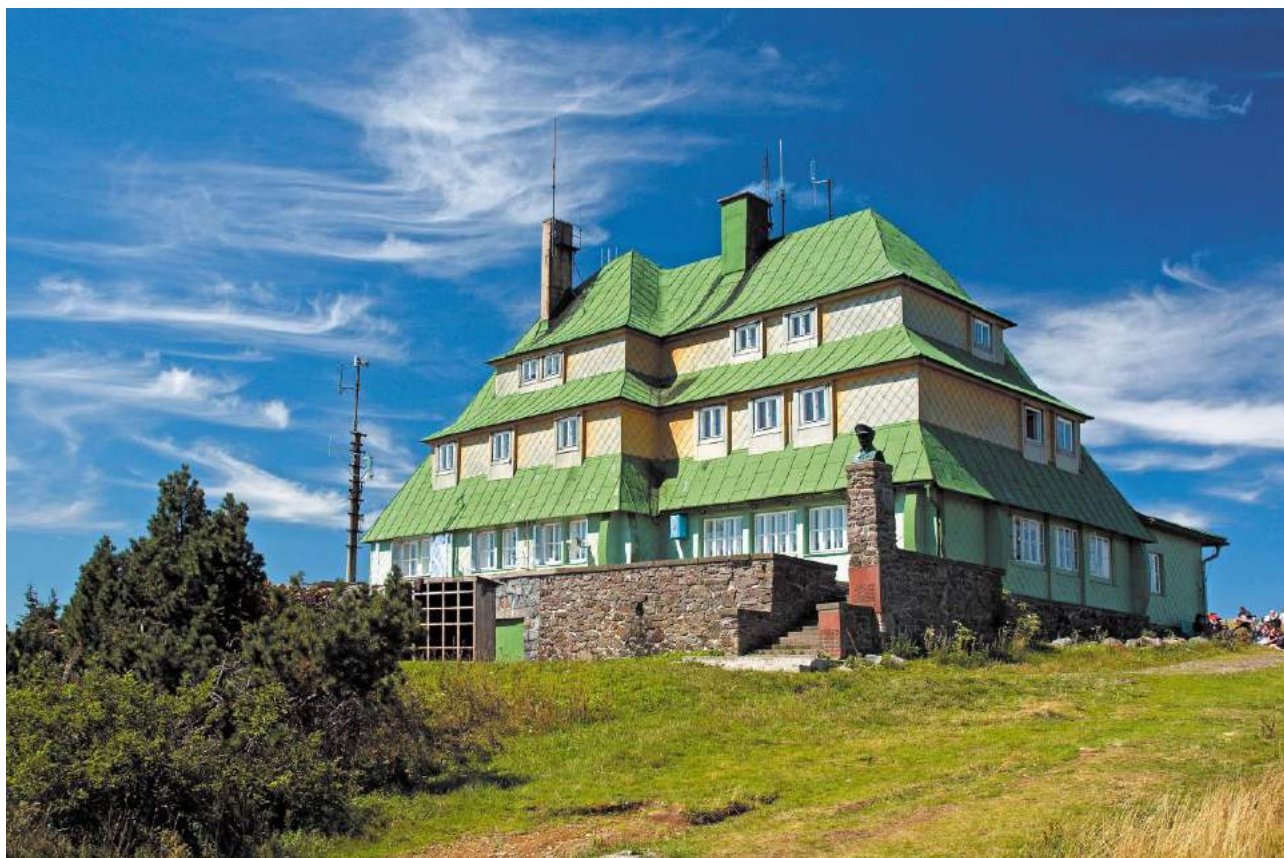
Schronisko Masarykowa Chata.