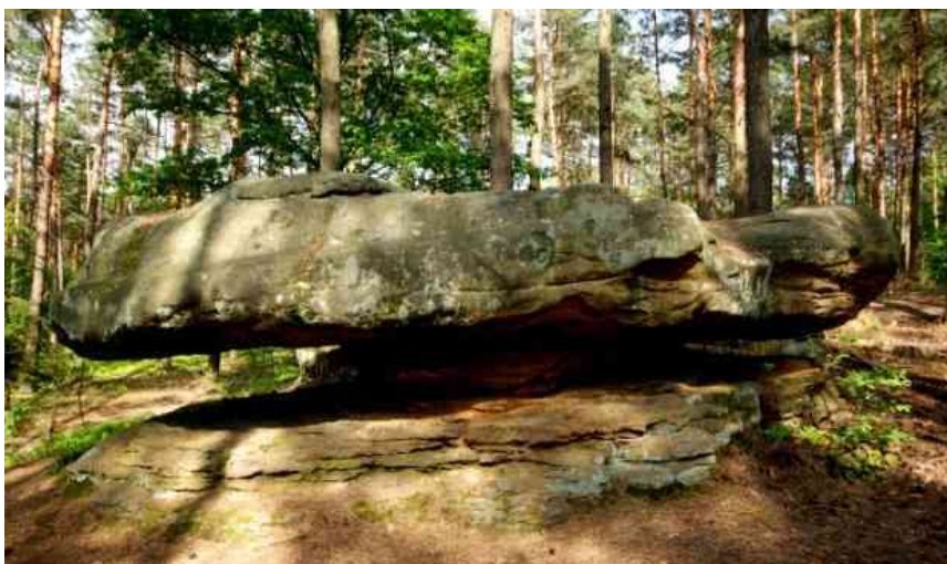
Rezarwat „Skaly w Krynkach”

Trasa dojazdu S(zielona strzałka)- Ośrodek Przystań Wodna – START, META, BAZA NOCLEGOWA